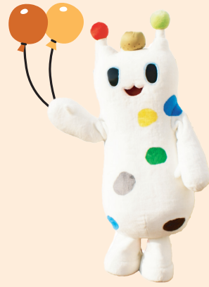
戸塚区のマスコット ウナシー