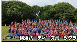
横浜ハーティースポーツクラブ