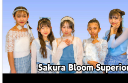
Sakura Bloom Superior