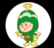
松実学園音楽コース